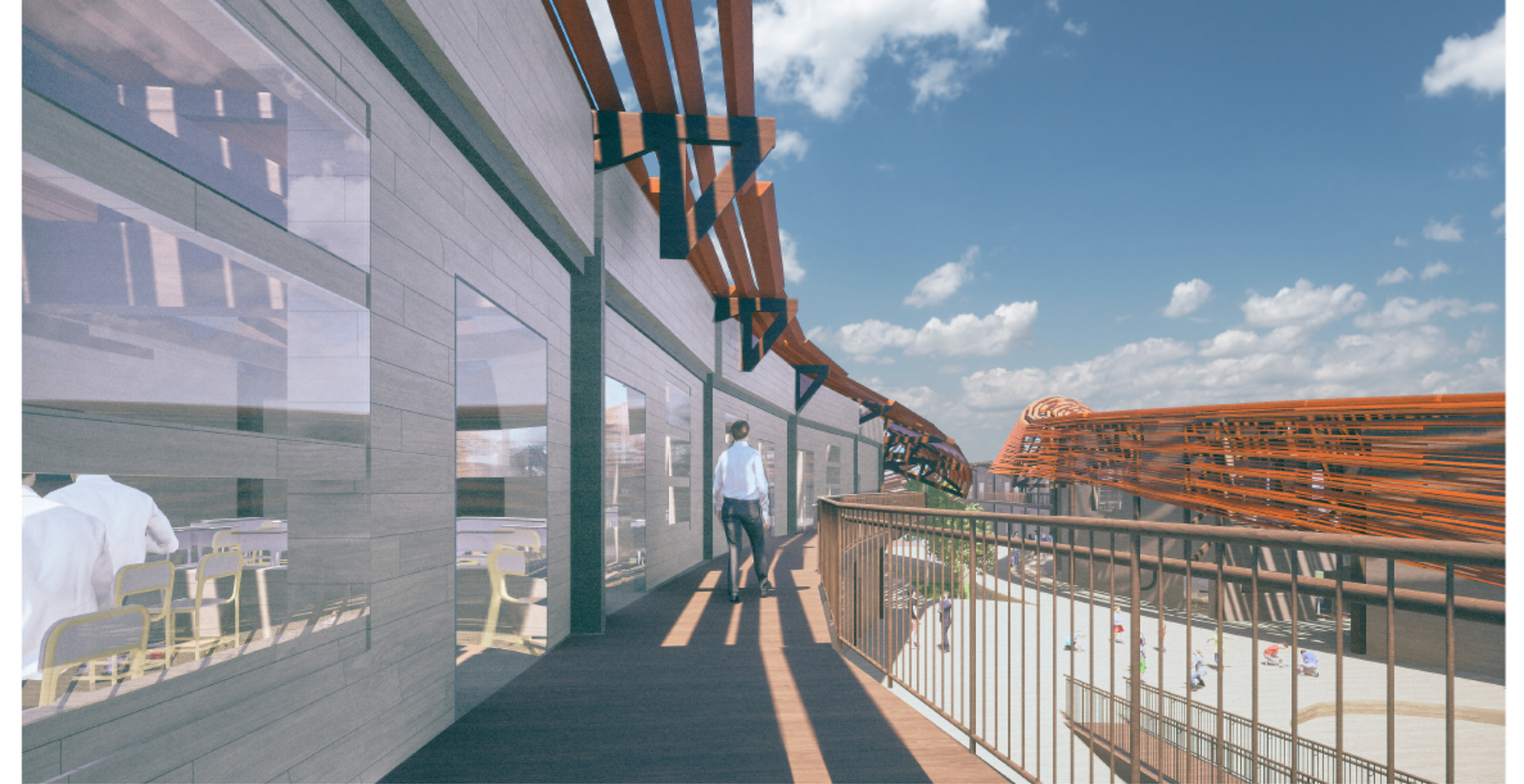
Vista exterior Este- Ed. Básica