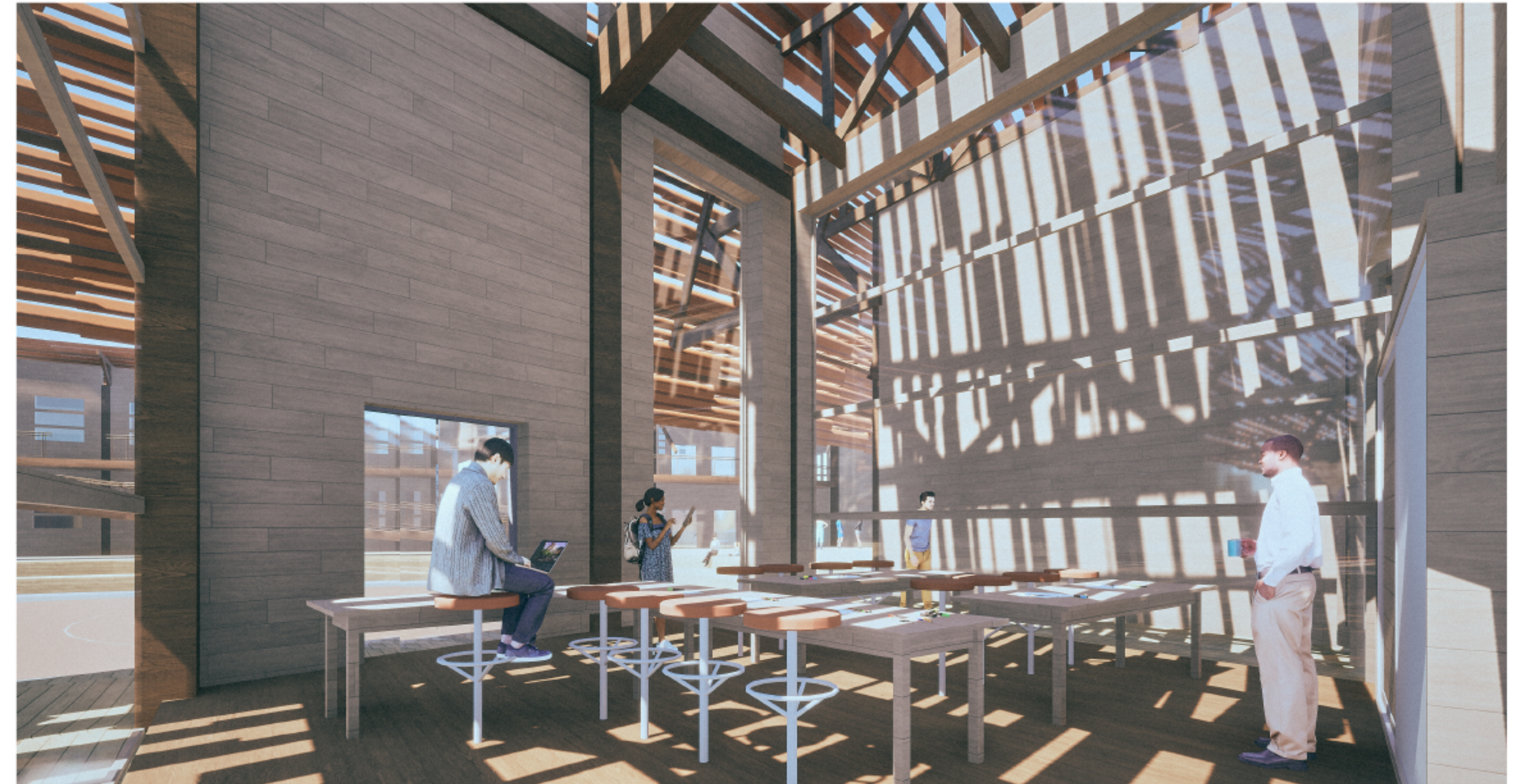
Vista Interior Taller técnico profesional, artesano