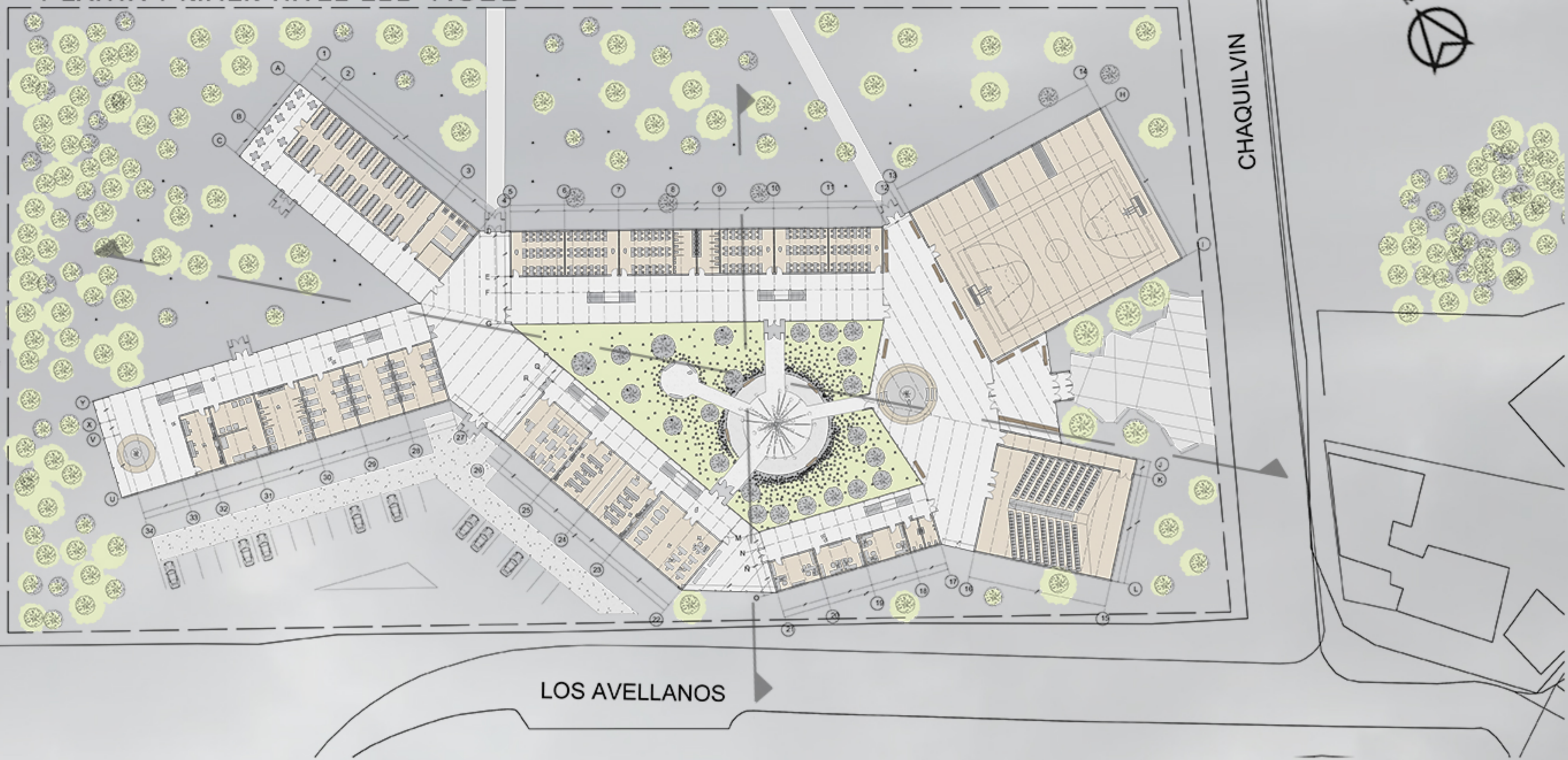
PLANTA PRIMER NIVEL ESC 1:500