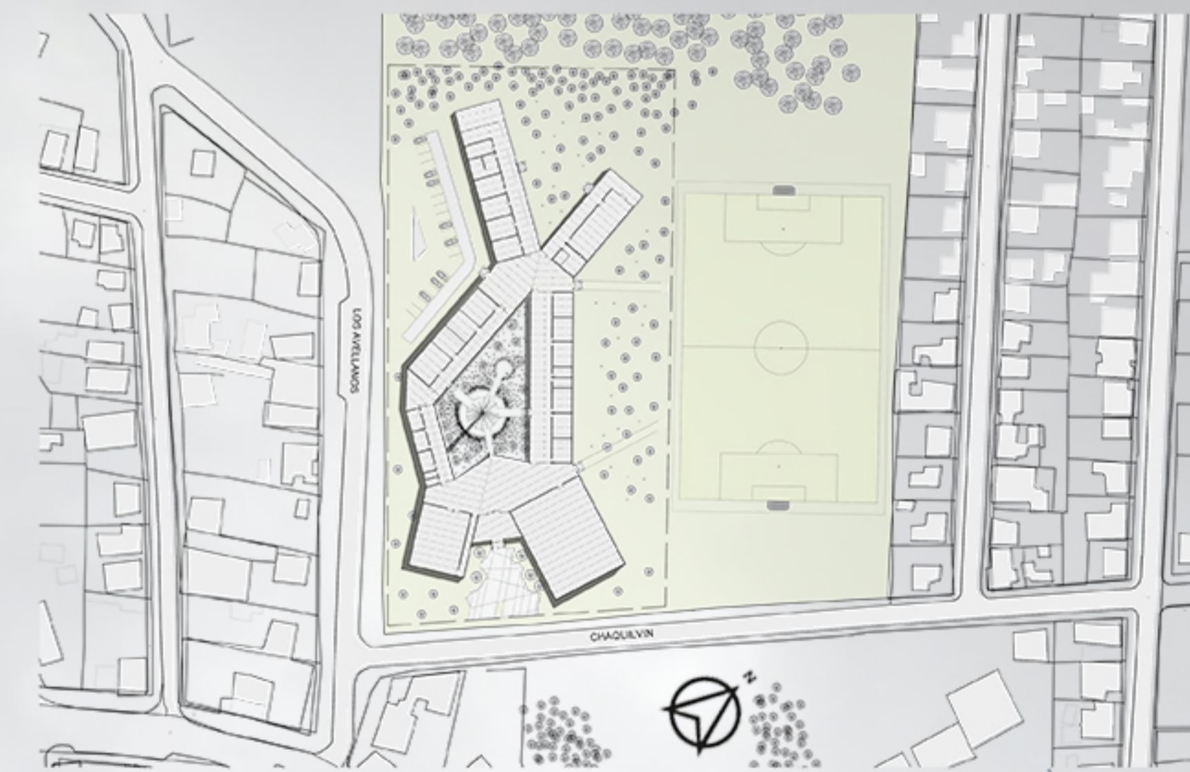
EMPLAZAMIENTO ESC 1:2000