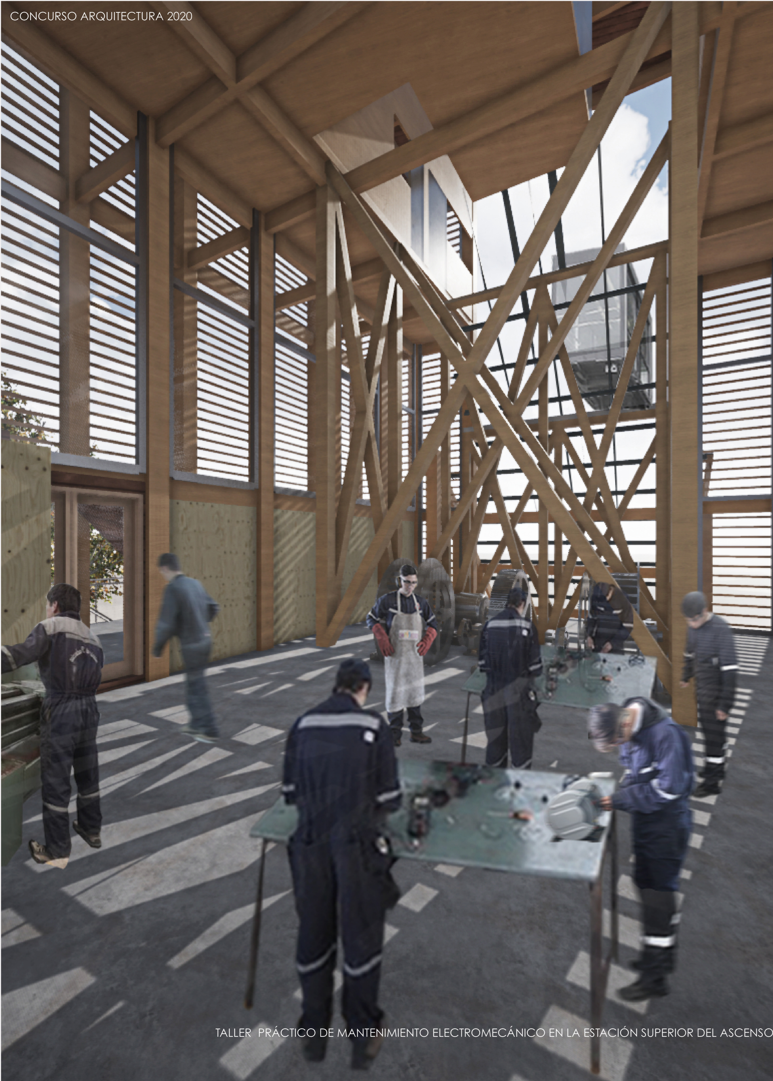
TALLER PRÁCTICO DE MANTENIMIENTO ELECTROMECÁNICO EN LA ESTACIÓN SUPERIOR DEL ASCENSOR