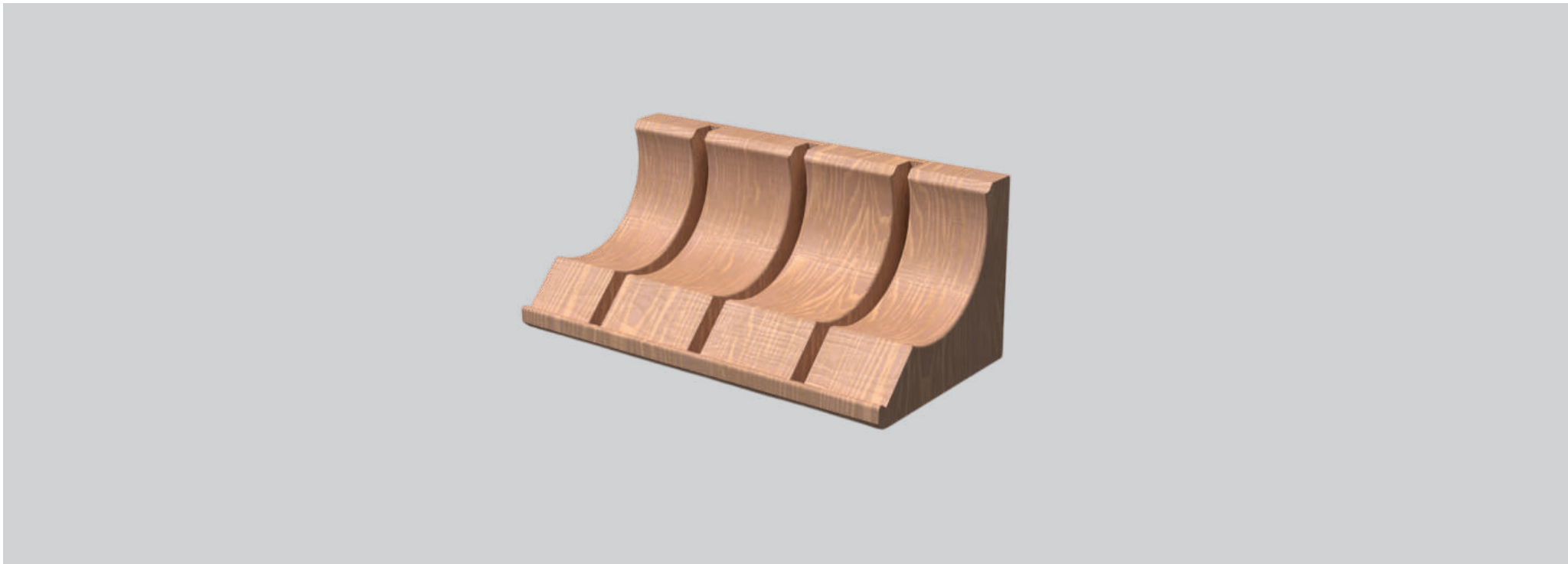
El soporte para bicicletas está diseñado en madera maciza con tres cavidades curvas que permiten insertar la rueda delantera