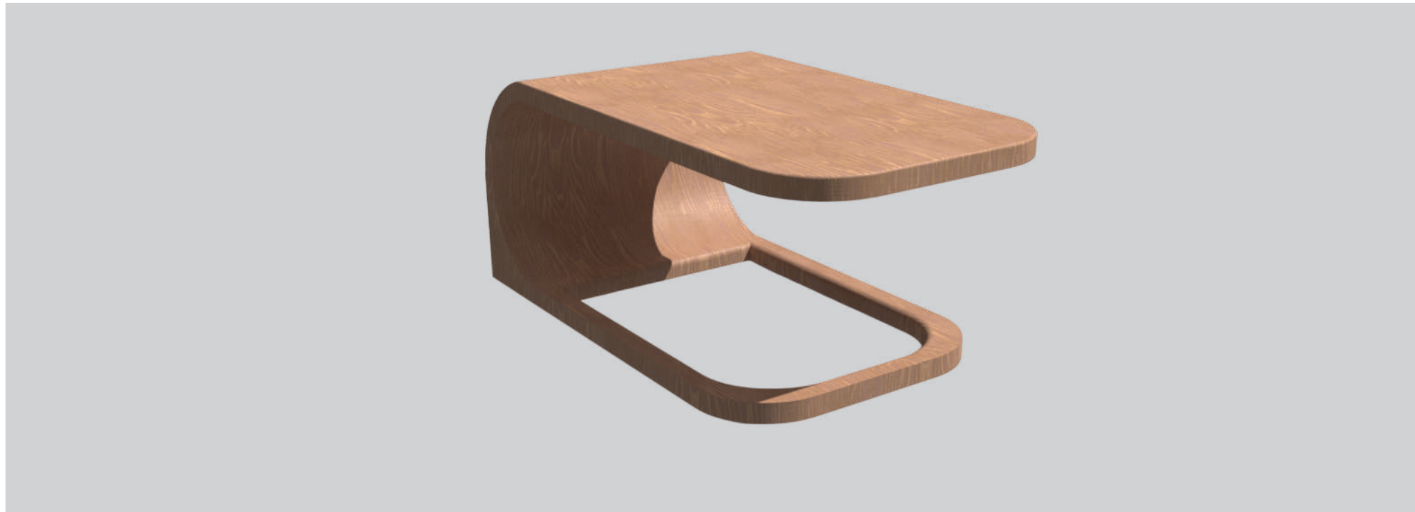
Mesa de estructura curva que actúa como punto de reunión