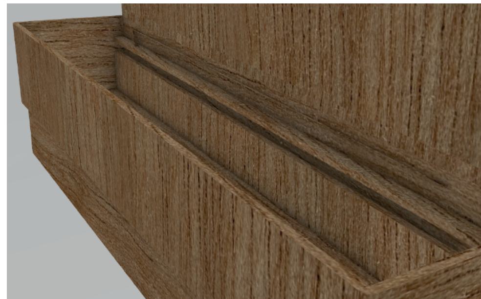
Sistema que conecta el sector natural con el agua donde se coloca el material que conduzca el agua