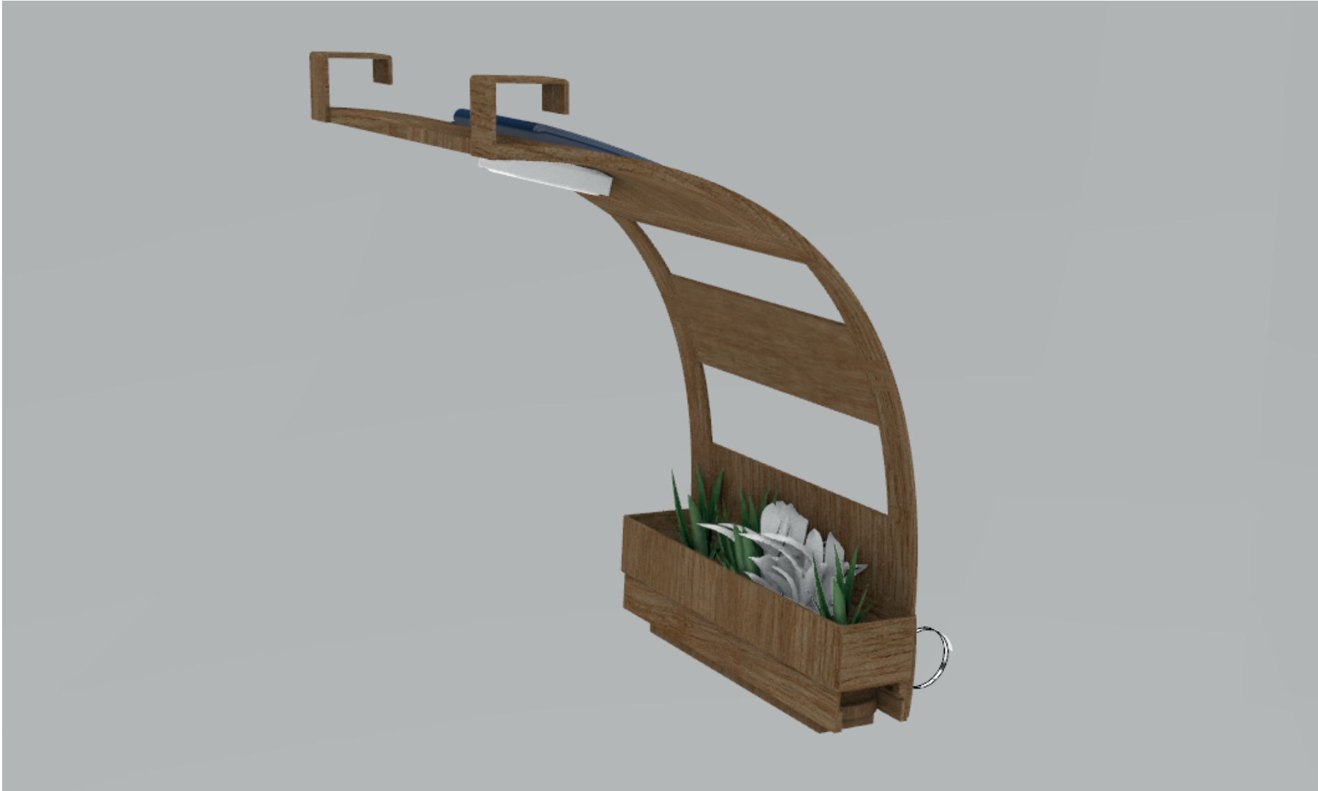
Vista en perspectiva del modulo TramoVivo para pasarelas