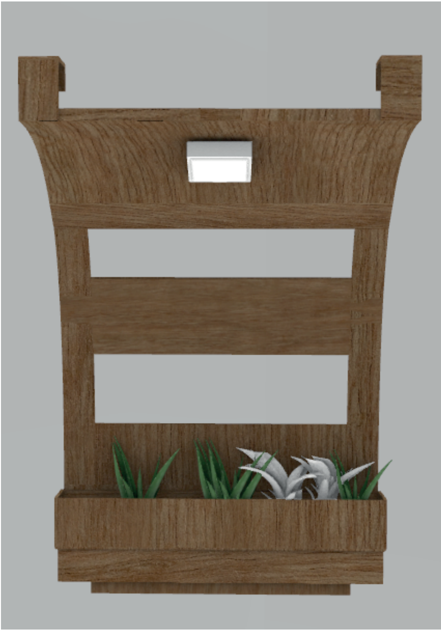
Vista frontal del modulo