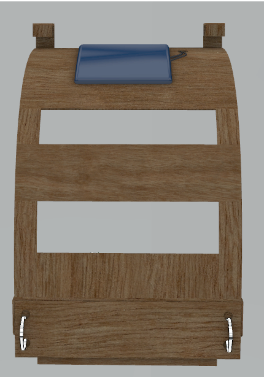
Vista posterior del modulo