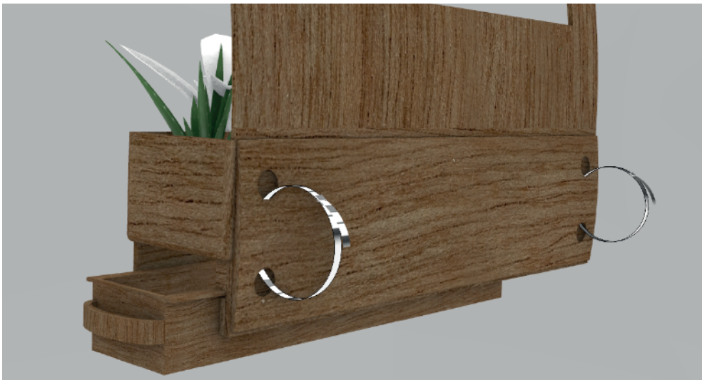
Sujeción a baranda de pasarela y orificios en el modulo mediante Zuncho metálico