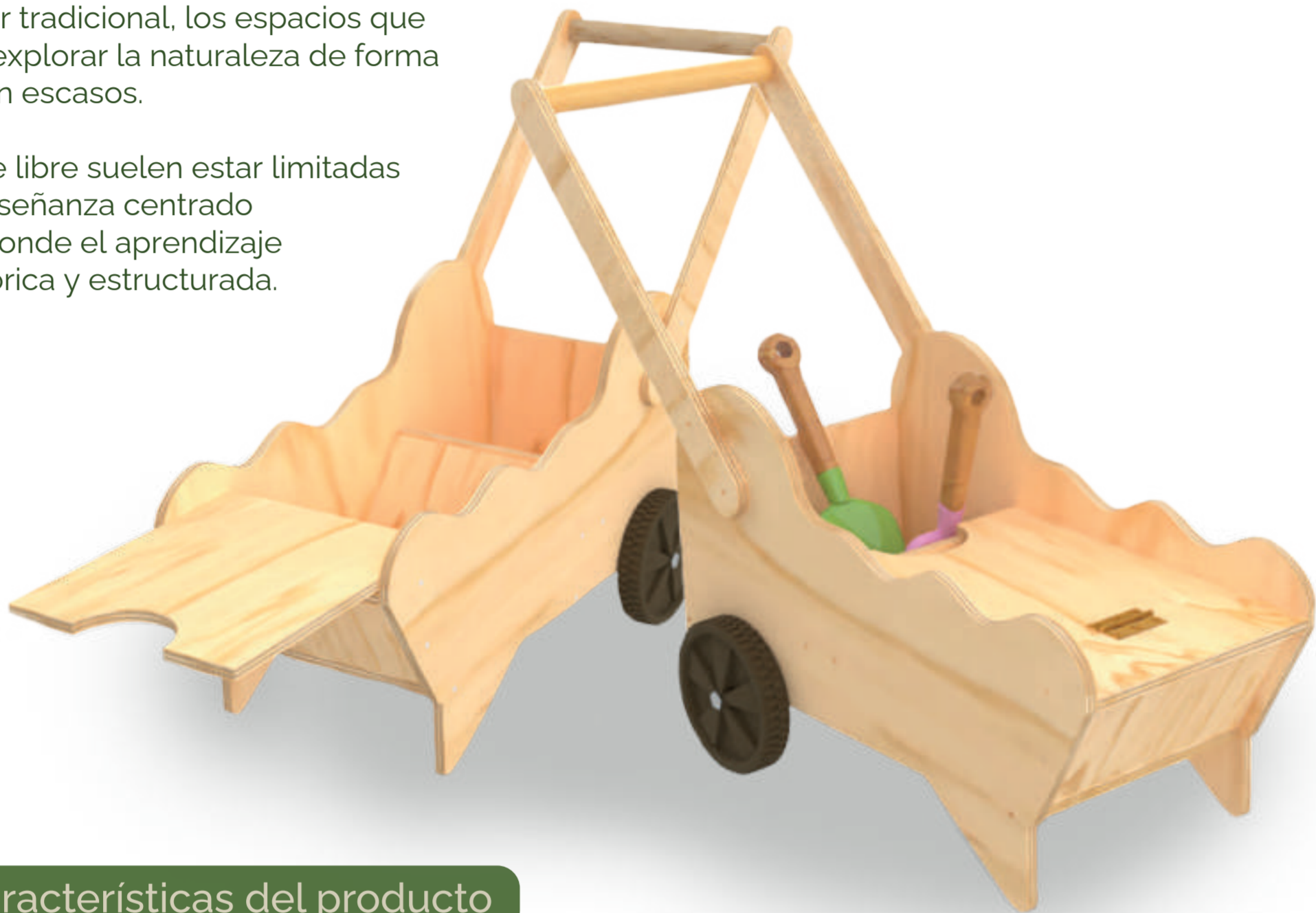
Diagrama de características del producto

Las actividades al aire libre suelen estar limitadas por un formato de enseñanza centrado en la sala de clases donde el aprendizaje ocurre de manera teórica y estructurada.