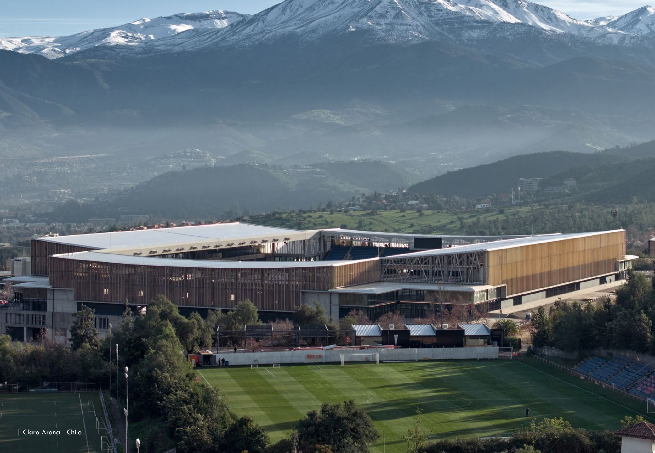
| Claro Arena - Chile