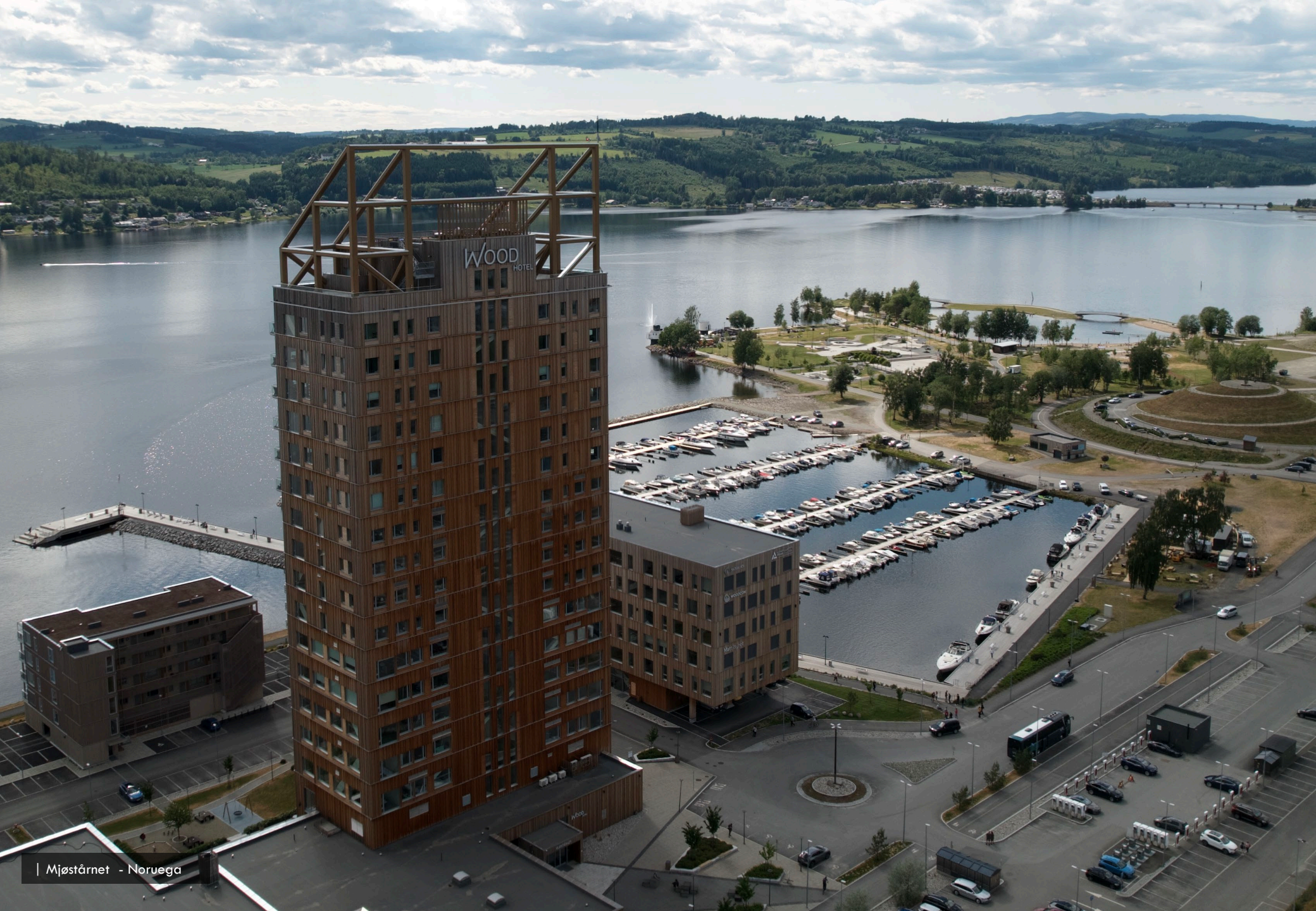
| Mjøstårnet - Noruega